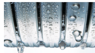
Радиальный теплообменник Inox-Radial