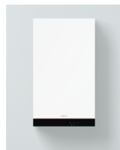
Vitodens 050-W (тип B0HA и B0KA)

Котлы 050-W испытаны и сертифицированы для работы на природном газе в соответствии со стандартом EN 15502.