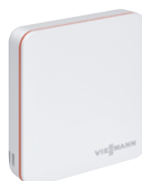
ViCare-термостат для большего комфорта и эффективности

Встроенное подключение к Интернету Котел поставляется со встроенным интерфейсом Wi-Fi.