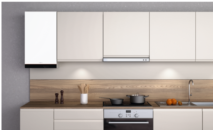
Котлы Vitodens 050-W имеют привлекательный дизайн с белым матовым порошковым покрытием Vitopearlwhite.

Являясь крупным производителем с многолетним опытом производства настенных котлов, мы точно знаем, что нужно нашим заказчикам. Вы можете положиться на качество продукции Viessmann – в том числе котлов Vitodens 050-W, отличающихся особенно привлекательной ценой. Поэтому настенные котлы Viessmann – это не только инновационные технологии и энергоэффективность, но и надежность и долговечность. Благодаря современным узлам газовой конденсационный котел не занимает много места и может быть установлен даже в небольших нишах. Боковые зазоры для обслуживания не требуются, все соединения легко доступны спереди.