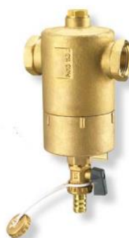
Рис. 1: Сепаратор шлама FAR – фиксированное соединение