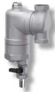
Рис. 2: Сепаратор шлама FAR – поворотное соединение