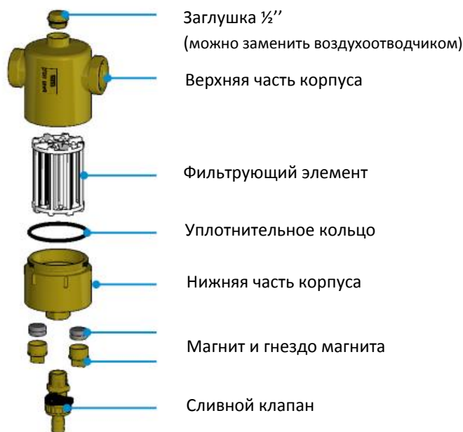
Рис. 3: Сепаратор шлама FAR – конструкция